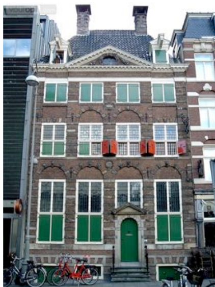
Rembrandt-Museum in Amsterdam

1639 trucken Rembrandt un Saskia in dat bekannte Huus in de Anthonisbreestraat, vandaag Jodenbreestraat Nr. 4, dat in de jödske Vördel van Amsterdam lagg. Vandaag is dort dat Rembrandthuus-Museum, dor sölen all Radeerungen van Rembrandt utstellt wesen.