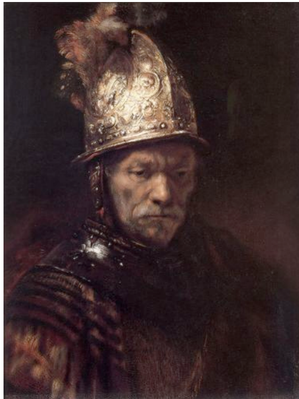
Dit Bild hangt in Berlin

Rembrandtexperten kriegen sük immer weer in d' Wull, of all Biller, de Rembrandt toeschreven worden, ok van hum sünd. Eenige sünd de Menen, dat Biller, de dat Teken Rembrandt dragen, van sien Skoelers maalt worden sünd. Fast steiht, dat dat berühmte Bild „De Mann mit de Goldhelm“ van een van sien Skoelers maalt worden is.