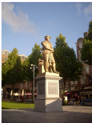
Rembrandt-Denkmal in Amsterdam

De eerst Dag hebben wi in de „Van der Valk Hotel Volendam“ in Katwoude, wohnt – blot slapen, beter geseegt. Natürelk hebben wi ok Volendam, de moi Stadt stuuw an `t Meer, besöcht. An de anner söven Tagen hebben wi toesaamen mit 66 Lü up dat hollandske Skipp „Anna Maria Agnes“ slapen. Smörgens gung dat, meistens van Klock acht of an, elk för sük, mit Rad up Tour. Dat Skipp fuhr wieder in ´n anner Stadt. Savens sünd wi dann dor weer an Boord gahn. Mit Rad sünd wi an de Dagen ruugweg 260 km dör ´n wunnerbaar Landskupp fahren. Anfangen sünd wi in Amsterdam, dorna Breukelen, Utrecht, Rotterdam, Delft, Dordrecht, Kinderdijk, Gouda, Schoonhoven, Beverwijk, Haarlem, Zaandam un toerügg na Amsterdam. In de Steden, de wi upsöcht hebben, giff dat sovöl Museen, dat dat neet mögelk is, de in de kört Tied all toe besöken. Wall mi besünners dat Leven un Warken van de Maler Rembrandt all immer interessert hett, was dat moi, dat ik up disse Tour de Maler in verskeden Steden noch beter kennenlernen kunn. Man dortoe later.