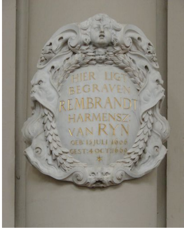
Westerkerk in Amsterdam mit Gedenktafel von Rembrandt

Leev Lesers, ik weet neet, of in latere Tieden ok anner Kinner de Naam Rembrandt kregen hemmen. Wenn wall, sünd disse Minsken aber neet so berühmt worden as de Hollander Rembrandt Harmenszoon van Rijn , de sien Biller ok na over 400 Jahr Minsken in de hele Welt blied maken. Ok in hunnerten van Jahren, wenn de Welt, wat ik hoop, noch besteiht, doent sük de Minsken over de wunnerbaar Biller, de Rembrandt maalt hett, freien. Dorvan bün ik overtügt!