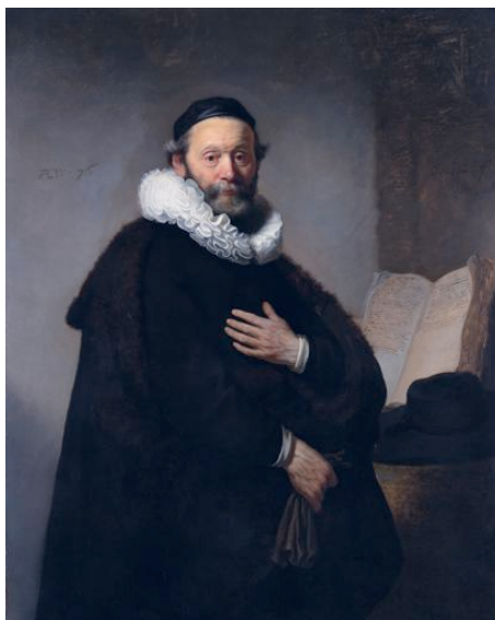
Porträt des Predigers Johannes Wtenbogaert, 1633, Rijksmuseum Amsterdam

In `t Jahr 1632 maalde he besünners völ „Porträts“, so de van Jacques de Ghey III, de hangt vandaag in London, de van Marten Looten in Los Angeles, de van Joris de Caullery in San Francisco, de van Maurits Huygens in Hambörg, de van Amalia van Solms in Paris un de van sük sülvst in Glasgow.