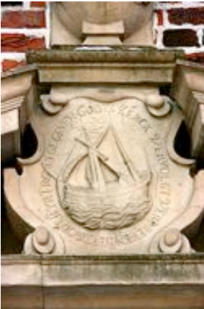
Das Schepken Christi

Inscrifft: „Godts kerck, vervolgt, verdreven, heft Godt hyr trost gegeven“ („Der Kirche Gottes, verfolgt, vertrieben, hat Gott hier Trost gegeben.“ Dat Portal overstunn de Bombenangrepen in de 2. Weltkrieg.