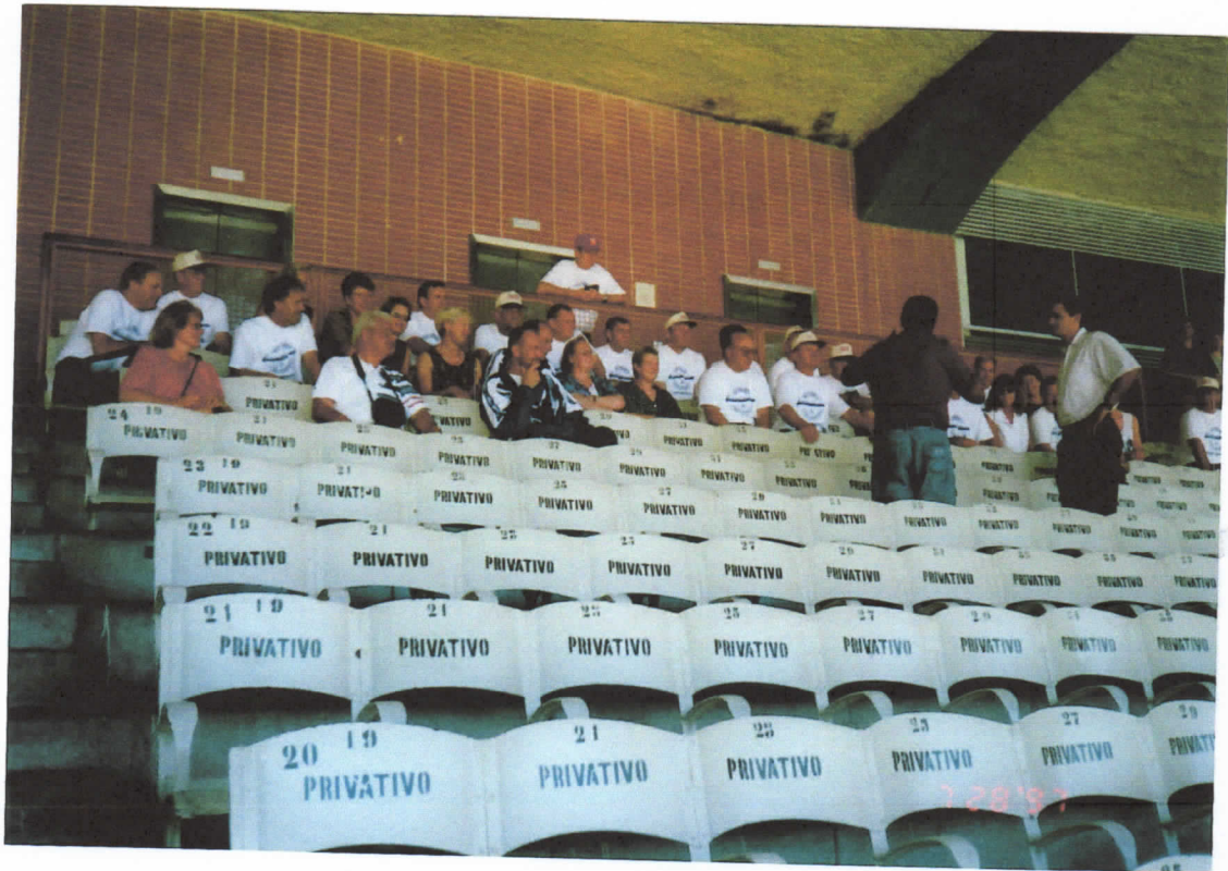
Führung im Maracanastadion