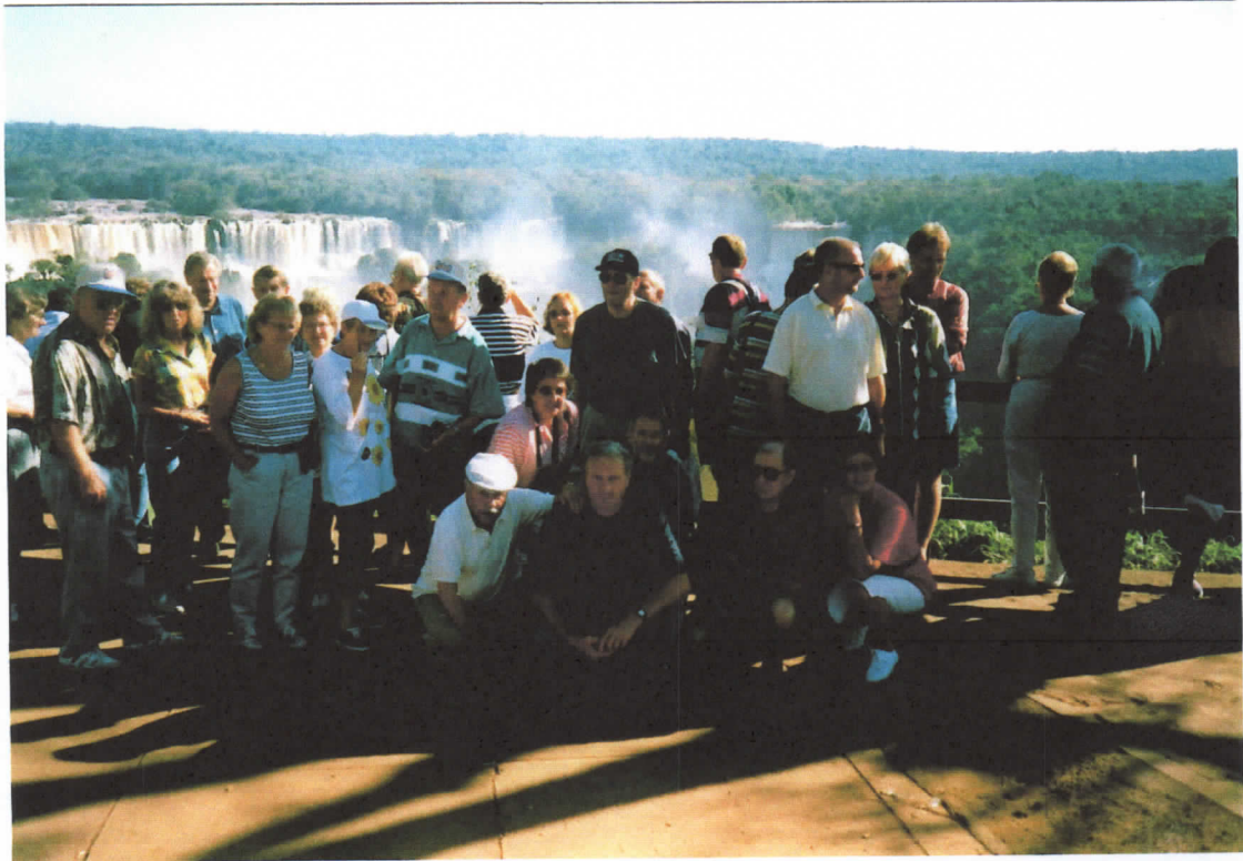
Vor den Wasserfällen von Spang