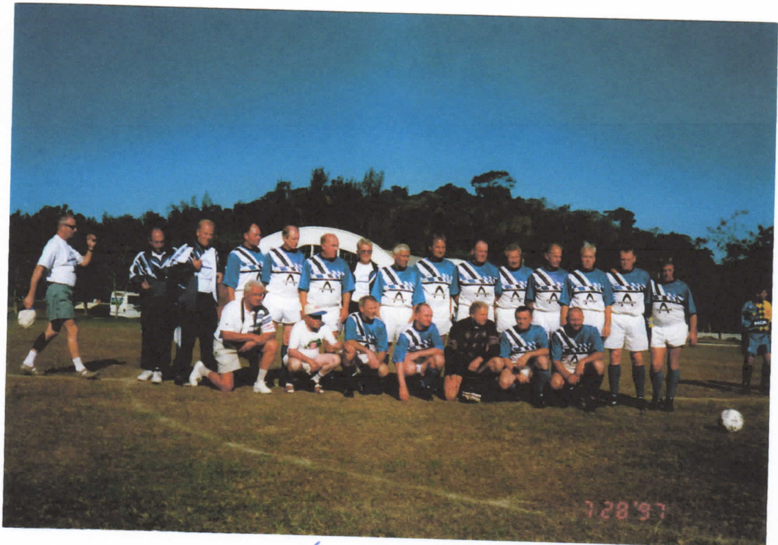
Vor dem 1. Spiel in Brasilien (0:0 in Rio)