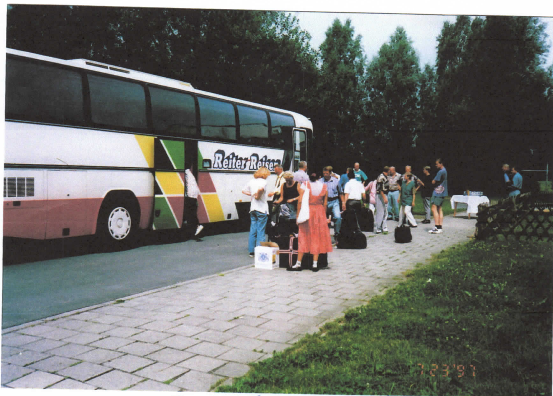
Abfahrt von Emden