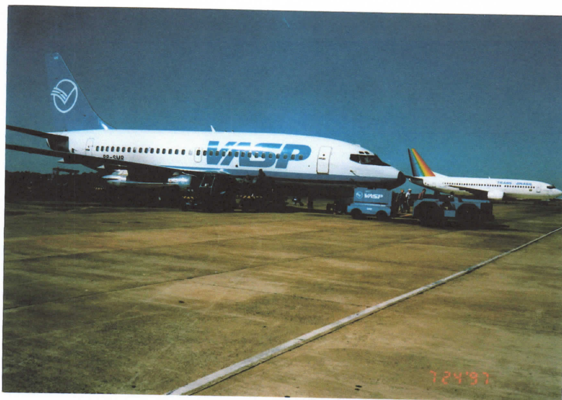
Belandet in Brasilien - São Paulo