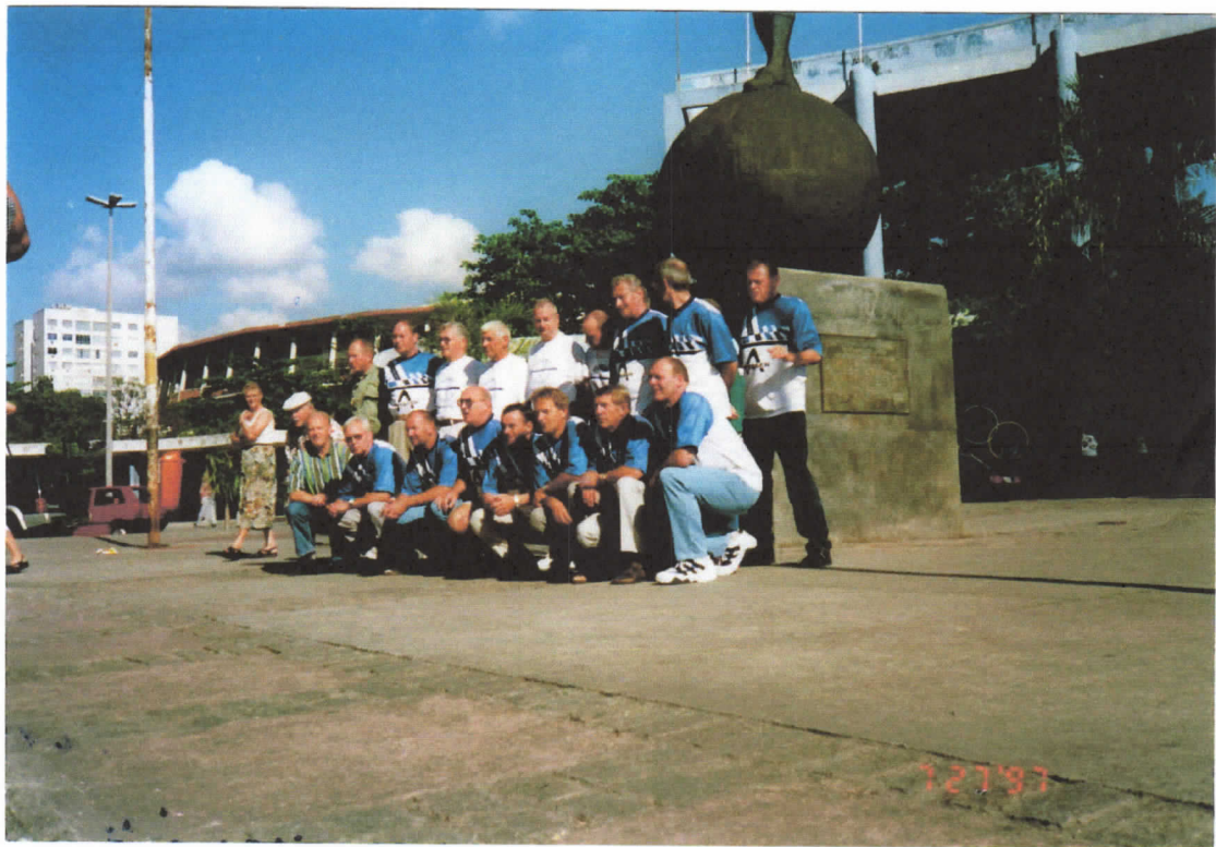
Vor dem Maracanã-Stadion in Rio